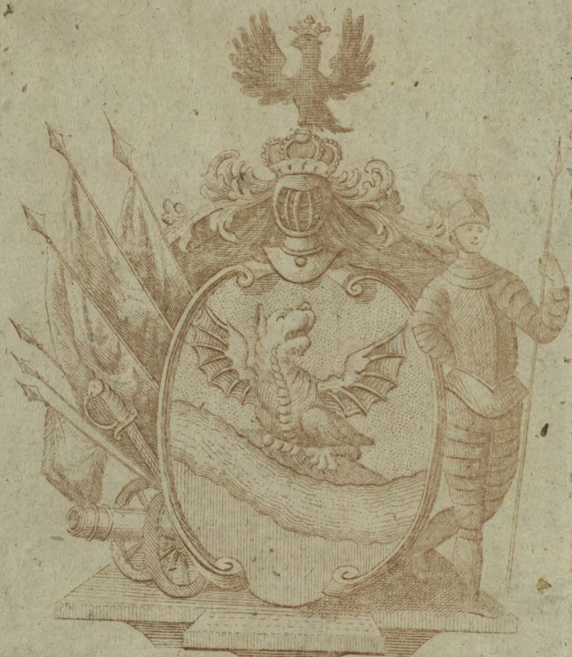
Insignia Domus Treverianae