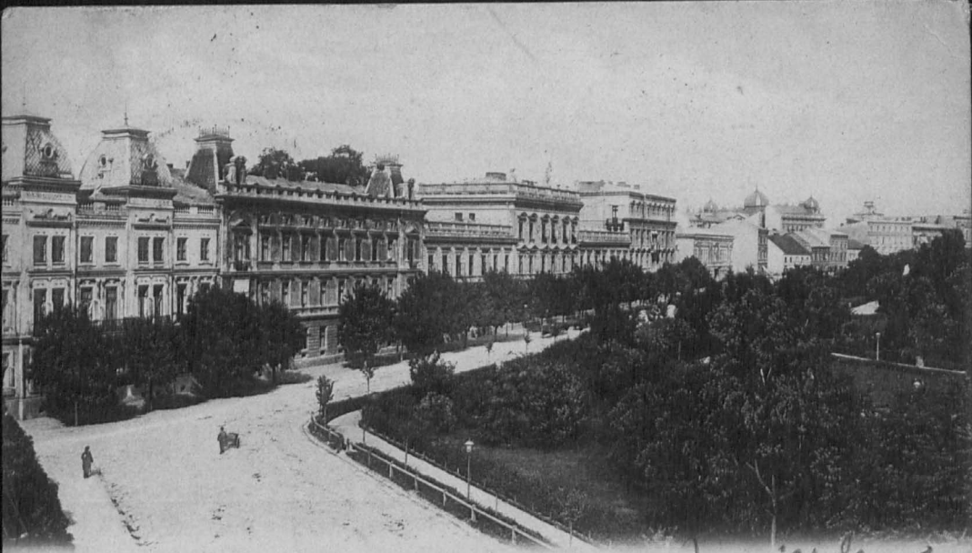
Ulica Basztowa w Krakowie.

Na dworku przed wyjściem. Całą noc oka nie zamkniję Osk