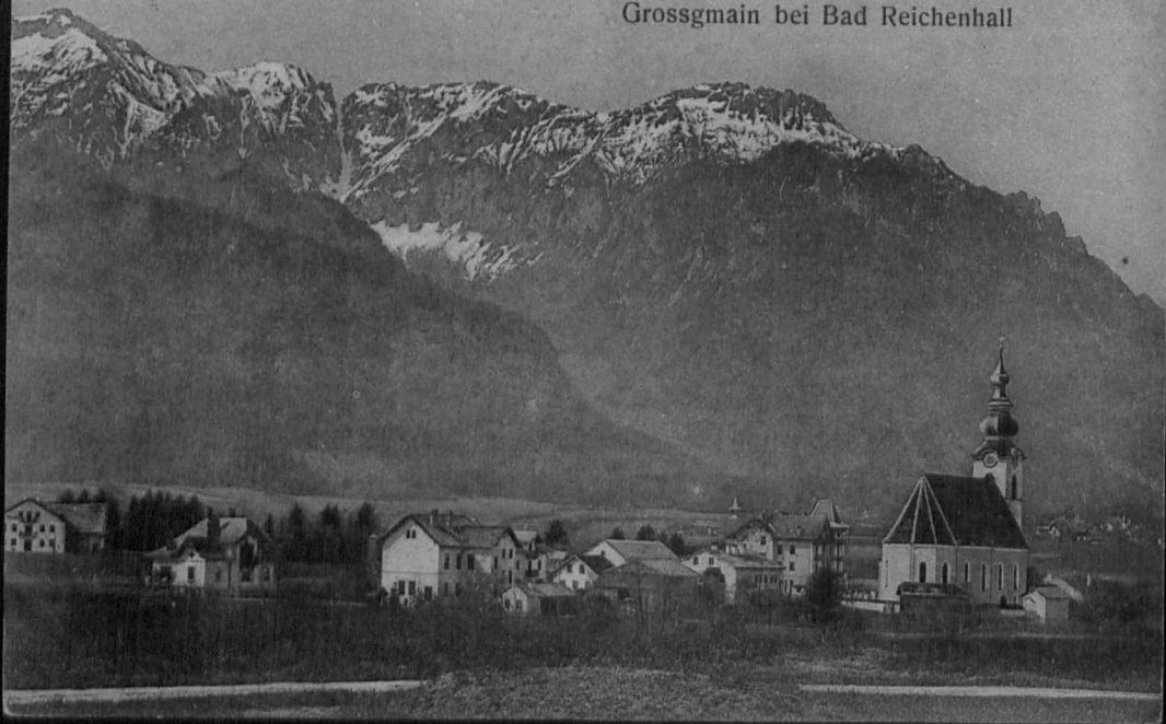
Grossgmain bei Bad Reichenhall