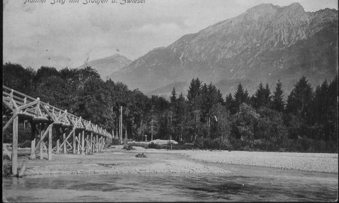
Nonner Steg mit Staufen u. Zwiesel