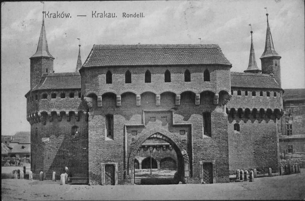
Kraków. — Krakau. Rondell.