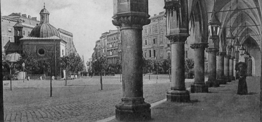
Kraków — Krakau Rynek i Kościół św. Wojciecha. Ring u. Adalbertkirche.