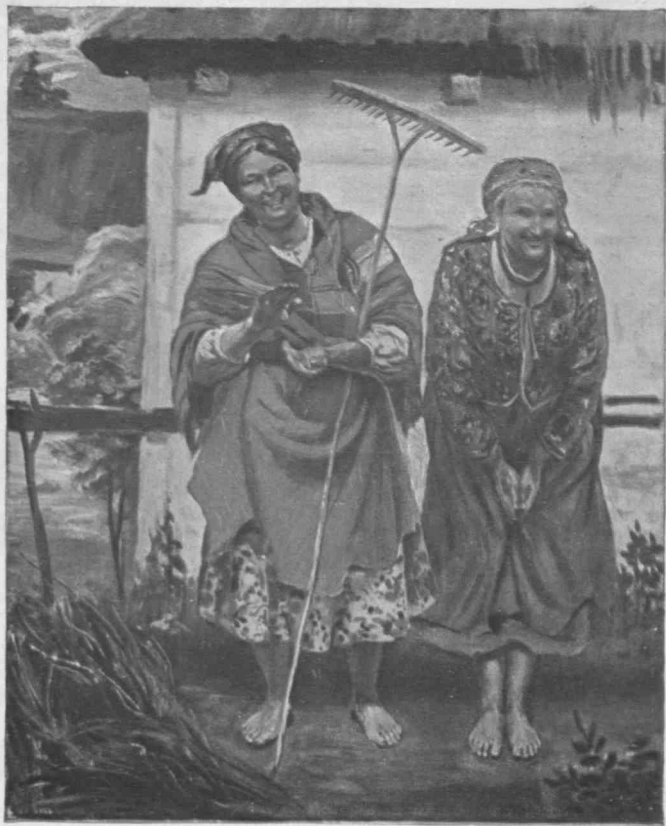
W. Wodzinowski: „Wesołe Krakowianki“.

„Joyeuses paysannes des environs de Cracovie“.