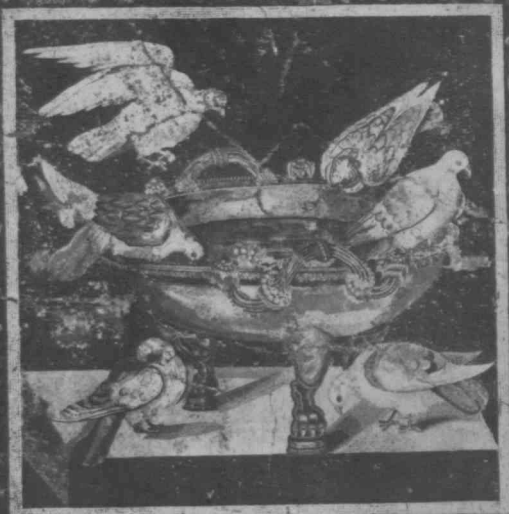
NAPOLI. Museo Nazionale; Tazza con colombe.

Uciastoz - skigaj lata, Lanim si spoirryz - odgoniz; vrelva jeniemy lisc' ronil Wios srebrzy na kromi brata. Dri pogon rubie jalz racta Ujebt romarszcki ma swary