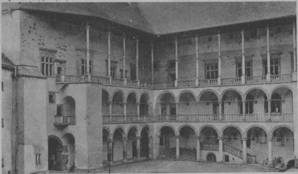
KRAKÓW. Krużganki Pałacu Królewskiego na Wawelu — Galeries du château royal.