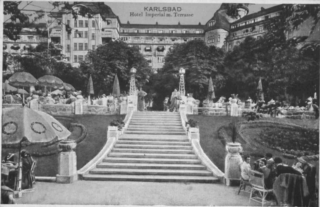
KARLSBAD Hotel Imperial m. Terrasse