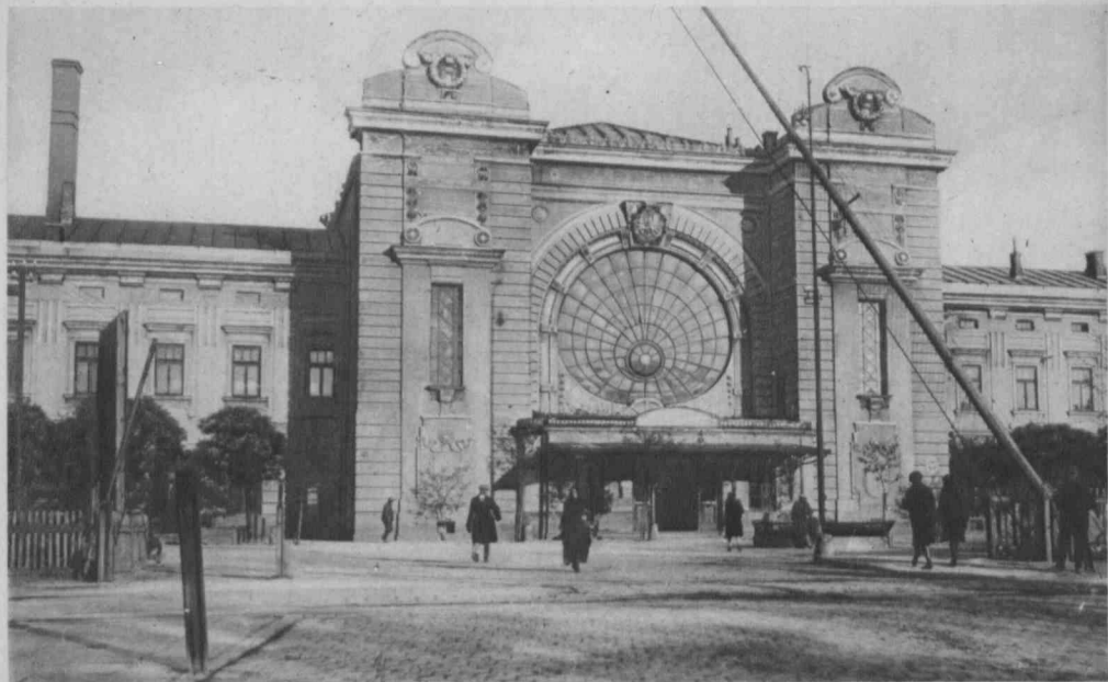
TARNOPOL. Dworzec kolejowy.