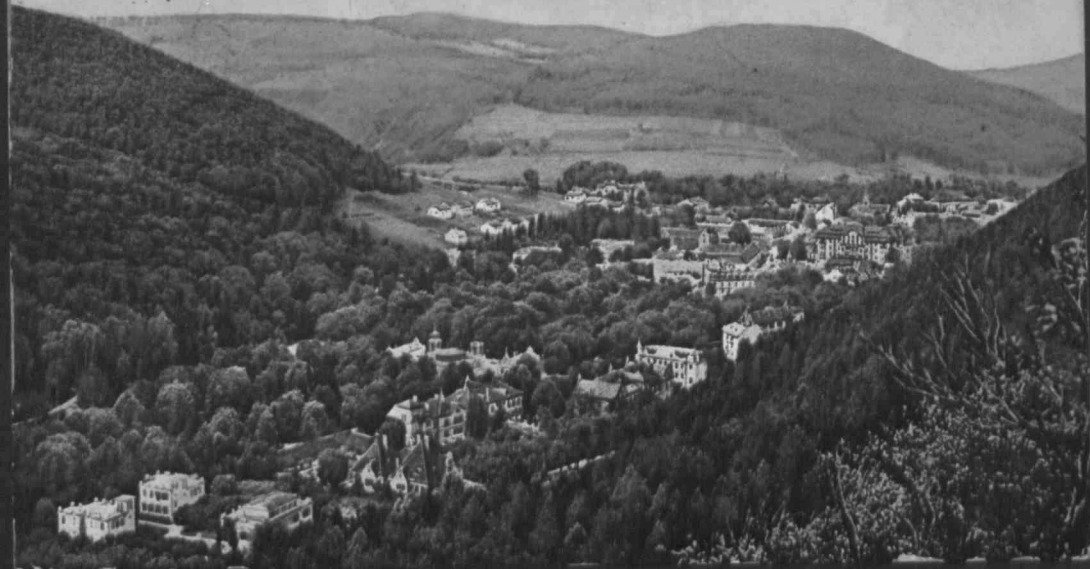
KÚPELE-TRENČ. TEPLICE. Celkový pohľad.