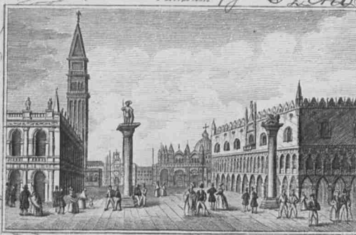
PIAZZETTA DI S. MARCO Venezia

Wielmożna Grabinia, y kuszawa Bratowa y Dobrodziejka!!!