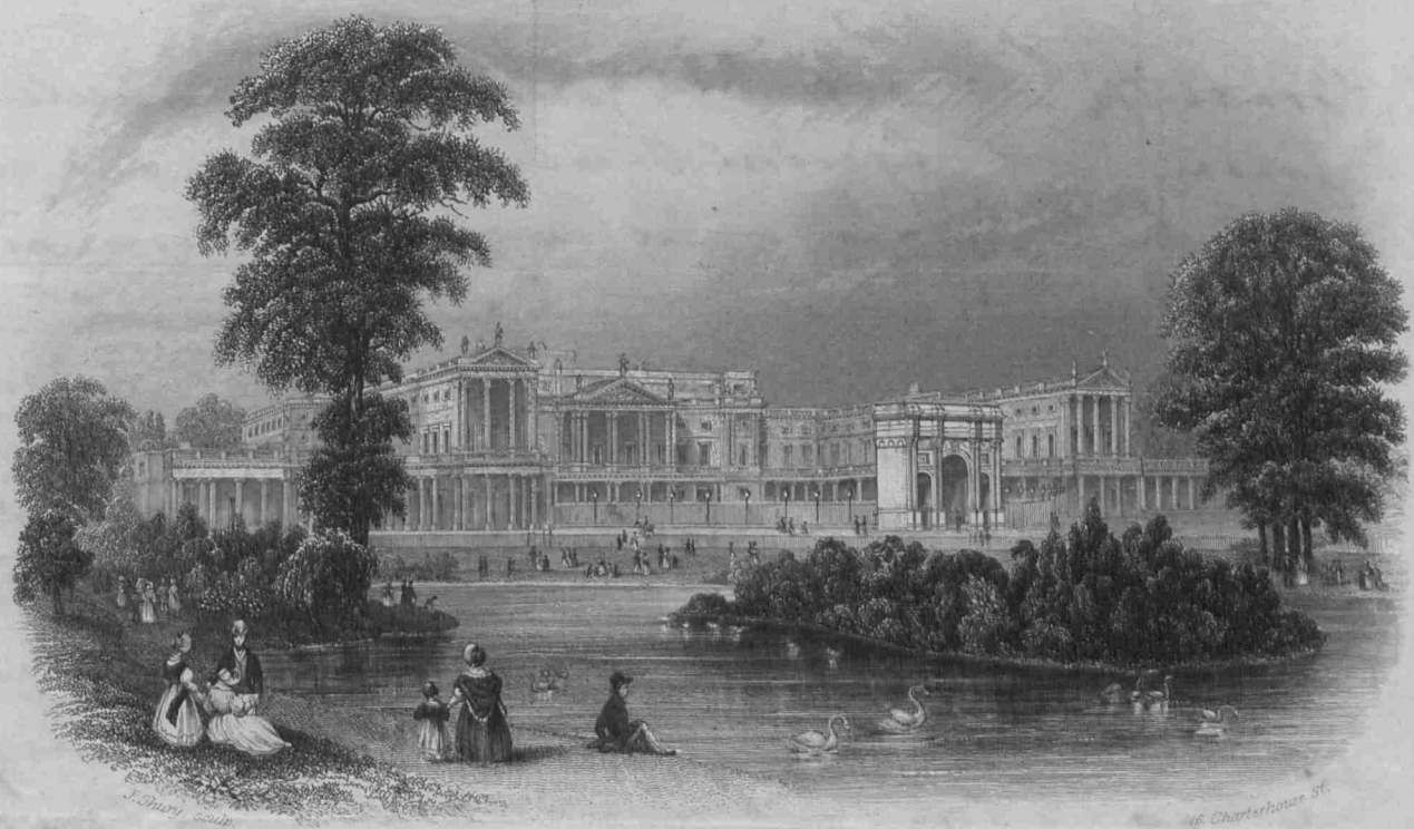
Buckingham Palace ST JAMES'S PARK.